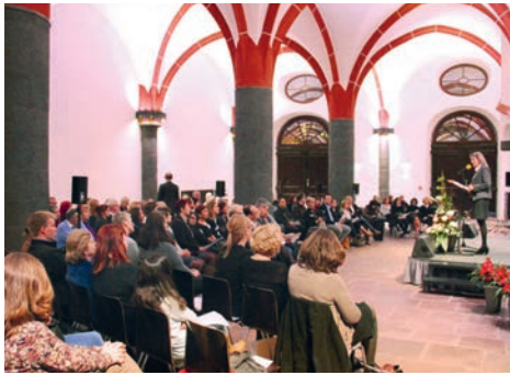
Feierstunde für Frankfurter Tagespflegepersonen in den Römerhallen.

Für die Familienstadt Frankfurt bedeuten die Tagesfamilien eine passende Ergänzung, eine wertvolle Alternative zu all den anderen Betreuungsangeboten der Stadt: Sie sind flexibel und professionell. Finanziell gefördert werden die Tagesfamilien durch die Stadt Frankfurt und das Land Hessen.