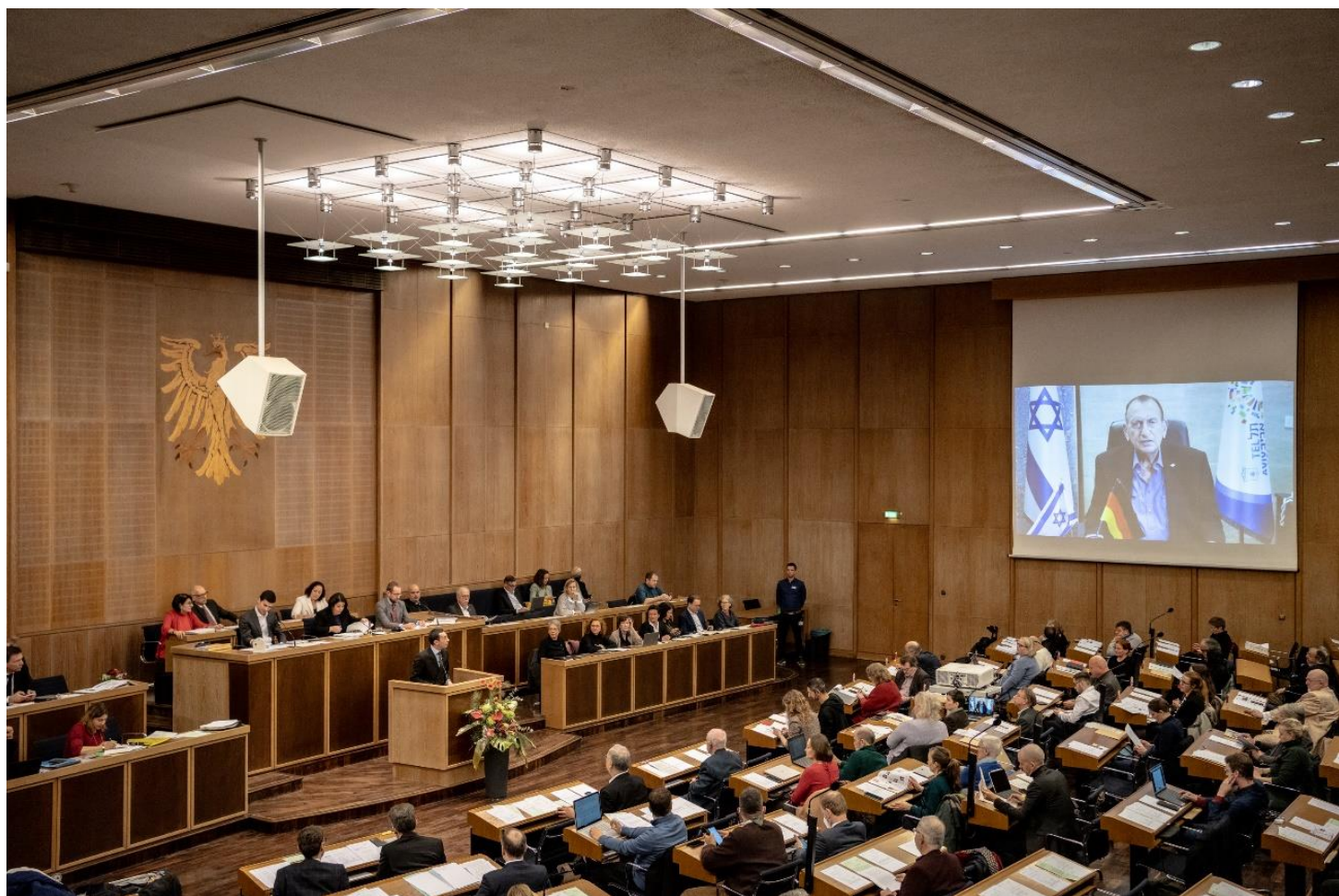
Videoansprache von Tel Avivs Oberbürgermeister Ron Huldai während der Stadtverordnetenversammlung im Plenarsaal des Römers