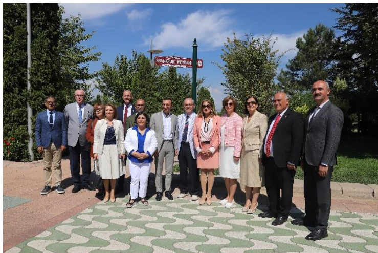
Einweihung des „Frankfurt Meydani“ in Eskişehir, Frankfurter Delegation und Vertreter:innen der Stadt Eskişehir, © Stadt Eskişehir.