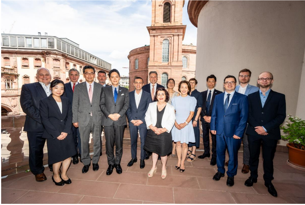
Oberbürgermeister Yamanaka, Oberbürgermeister Josef und Stadtverordnetenvorsteherin Arslaner mit der japanischen Delegation, © Stadt Frankfurt am Main, Foto: Holger Menzel.