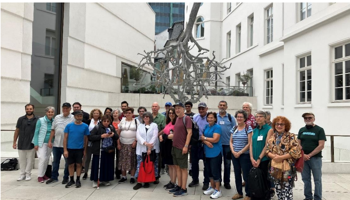
Die Teilnehmenden des Jüdischen Besuchsprogramms 2023 vor dem Jüdischen Museum, © Stadt Frankfurt am Main.

Zudem hat das Referat für Internationale Angelegenheiten 2023 ein Konzept zur künftigen Durchführung und Finanzierung des Programms erarbeitet, das im Februar 2024 von der Stadtverordnetenversammlung angenommen wurde. So konnte der Fortgang des Besuchsprogramms ab 2024 sichergestellt werden.