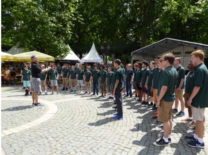
Auftritt des Keystone State Boychoir auf dem Opernplatz