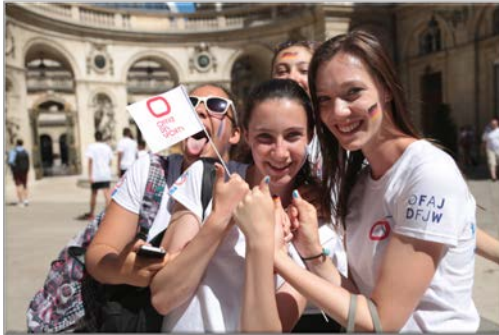
Teilnehmer/innen des Europod 2017