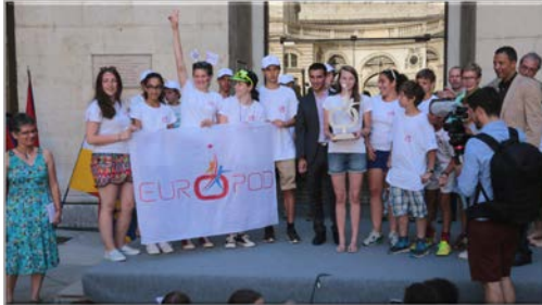
Teilnehmer/innen des Europod 2017