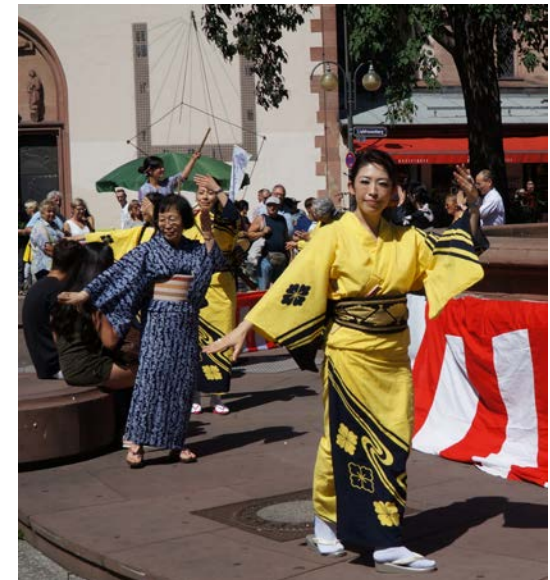
Bon-Odori Tänzerinnen auf dem Liebfrauenberg

In klassische Kimonos gekleidet, freuten sich die japanischen Tänzerinnen und Tänzer, nicht nur Teile ihrer japanischen Kultur in Deutschland zu präsentieren zu können, sondern auch darüber, dass es wieder gelang, zahlreiche Frankfurter Bürgerinnen und Bürger zum Mitmachen zu animieren.