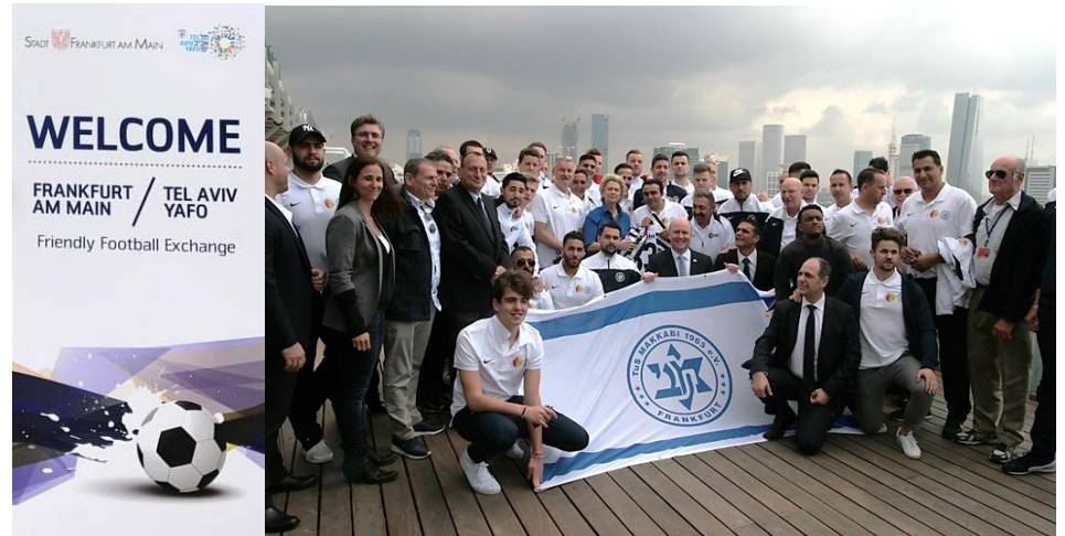
Delegation aus Frankfurt mit den Spielern v. TuS Makkabi