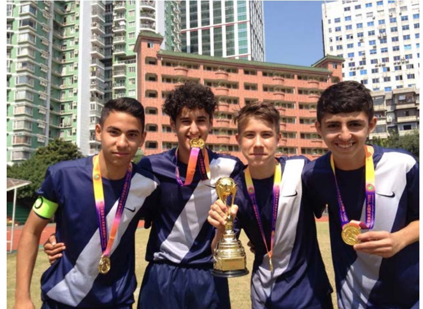
Spieler der Carl-von-Weinbergschule Frankfurt

2018 heißt es dann „am Ball bleiben!“, denn das Vier-Städte Fußball-Turnier wird in Frankfurt fortgesetzt.