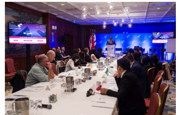
Toronto Partnership Symposium