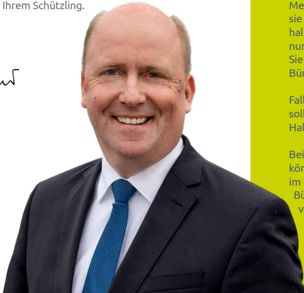
Uwe Becker Bürgermeister, Stadtkämmerer

Bei Geburt oder Umzug müssen Sie als Bürgerin und Bürger Ihren Nachwuchs oder sich selbst anmelden. Ähnliches gilt für Hunde. Auch sie müssen an-, um- und abgemeldet werden. Nach der Hundesteuersatzung haben Sie Ihren Hund innerhalb von zwei Wochen nach der Aufnahme in Ihren Haushalt oder dem Zuzug nach Frankfurt am Main anzumelden. Bei Nachwuchs Ihres Hundes sind die Welpen innerhalb von zwei Wochen, nachdem sie drei Monate alt geworden sind, anzumelden.