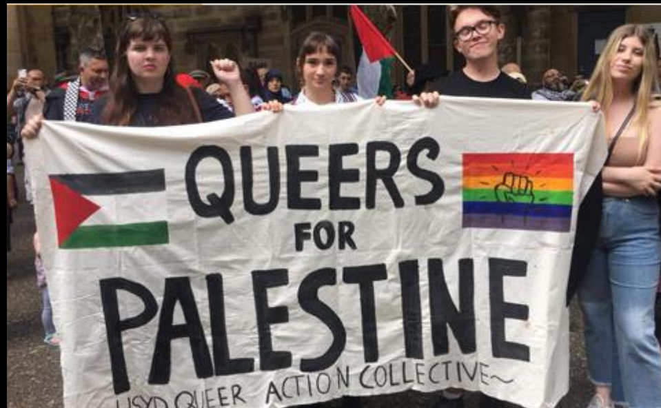
Demo Sydney 2017