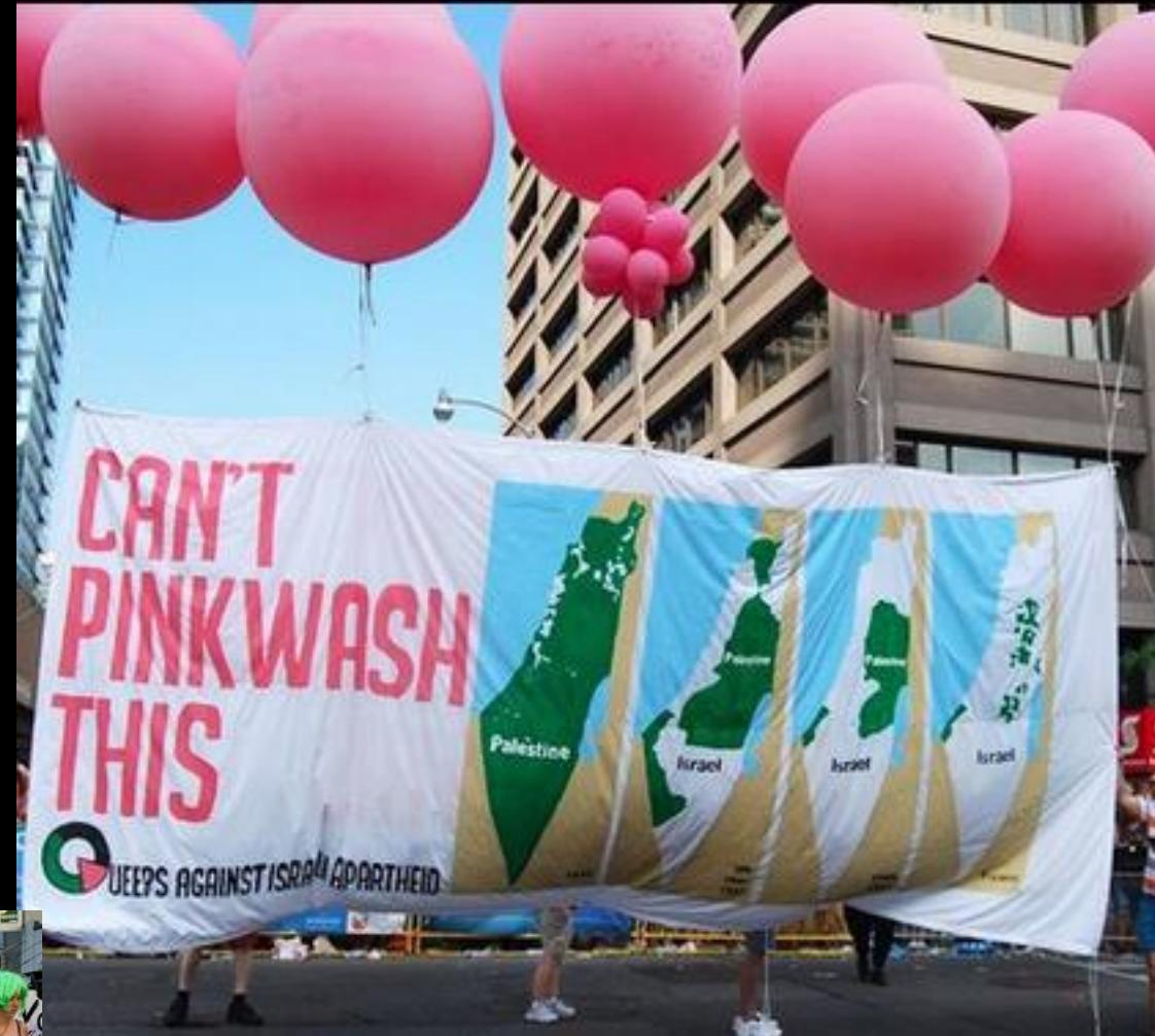
Demo USA 2016