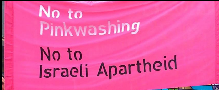
„No Pinkwashing“ United Kingdom