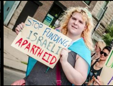
Chicago Demo 2016