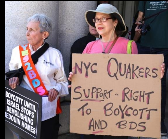
15. Juni 2016, New York, Pro-Palästina Demonstration

[Quakers sind eine internationale christliche, religiöse Vereinigung]