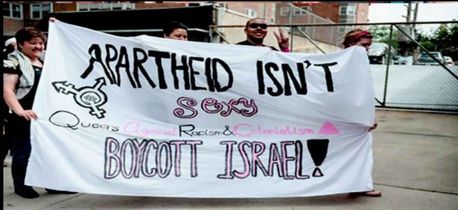
Chicago Demo 2016