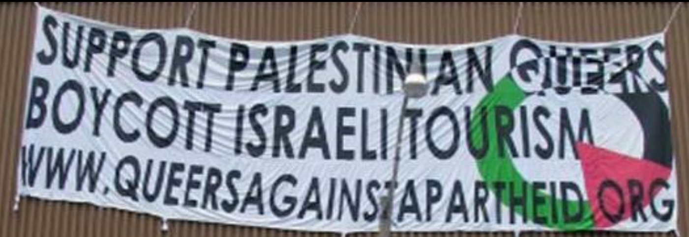
Pride Parade in Toronto (Kanada)