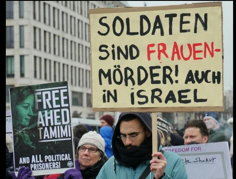
Women’s March Berlin 2018