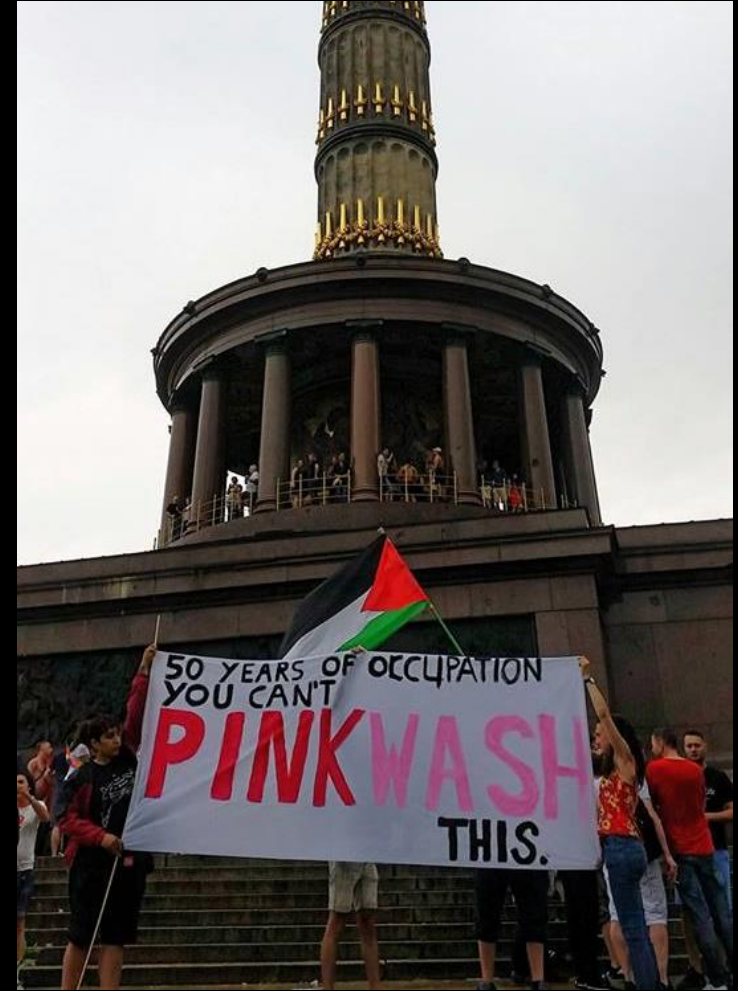
Berlin Against Pinkwashing