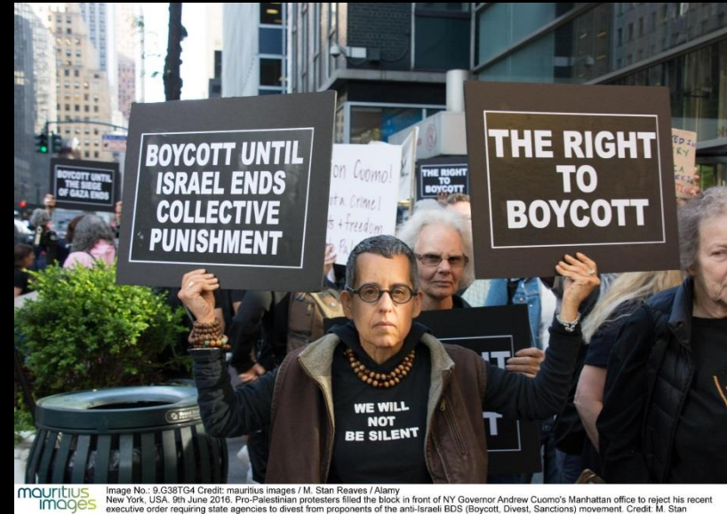
Image No.: 9.638764 New York, USA, 9th June 2016. Pro-Palestinian protesters filed the block in front of NY Governor Andrew Cuomo's Manhattan office to reject his recent executive order requiring state agencies to divest from proponents of the anti-Israeli BDS (Boycott, Divest, Sanctions) movement.

http://bdsberlin.org/ , https://bdsmovement.net/ , http://bds-kampagne.de/