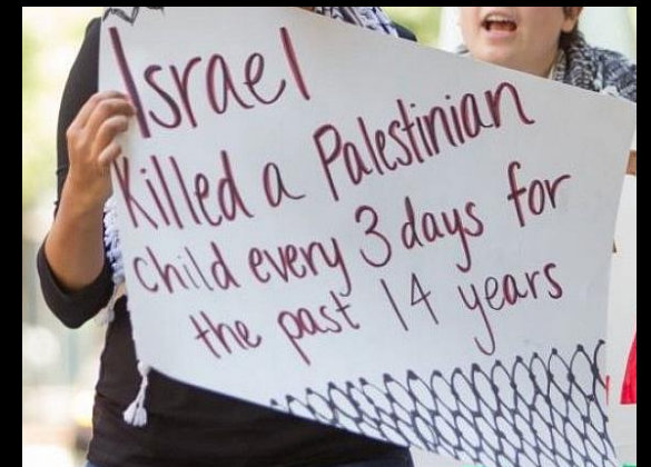
Demo Boston 2014