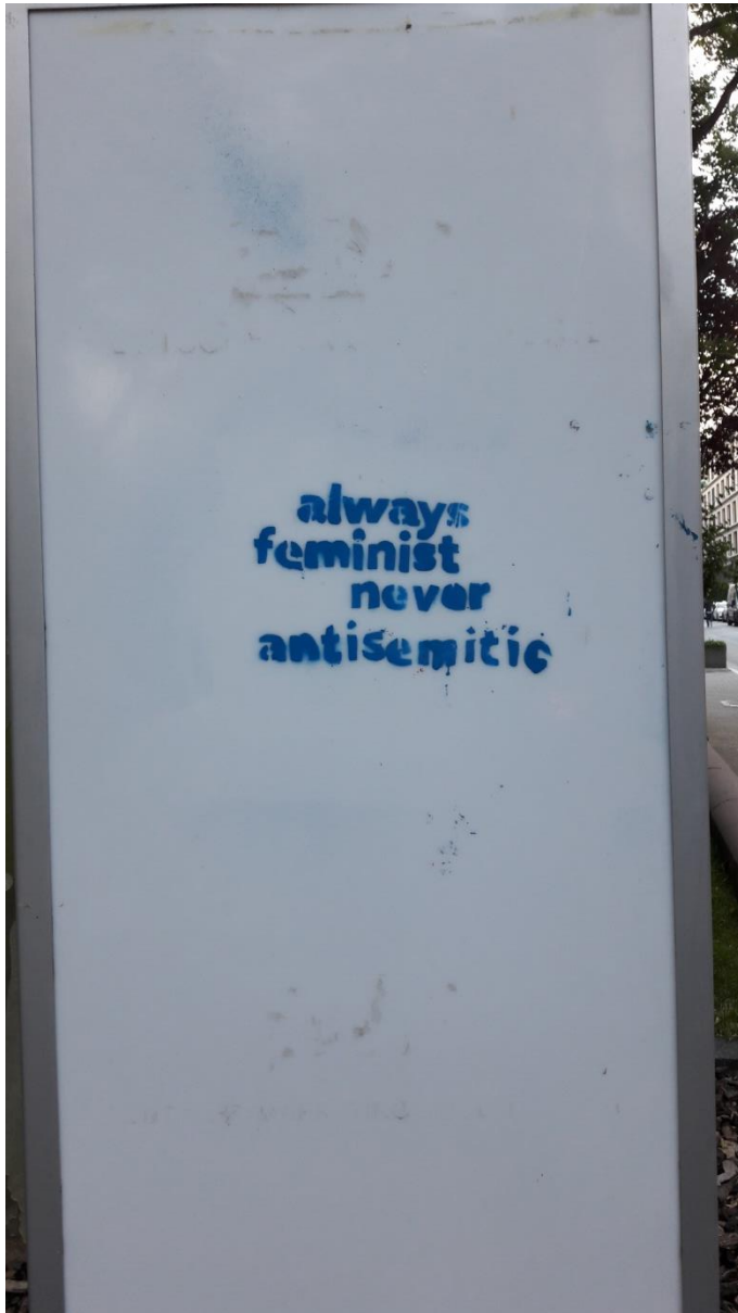
Gesehen im Kettenhofweg FfM