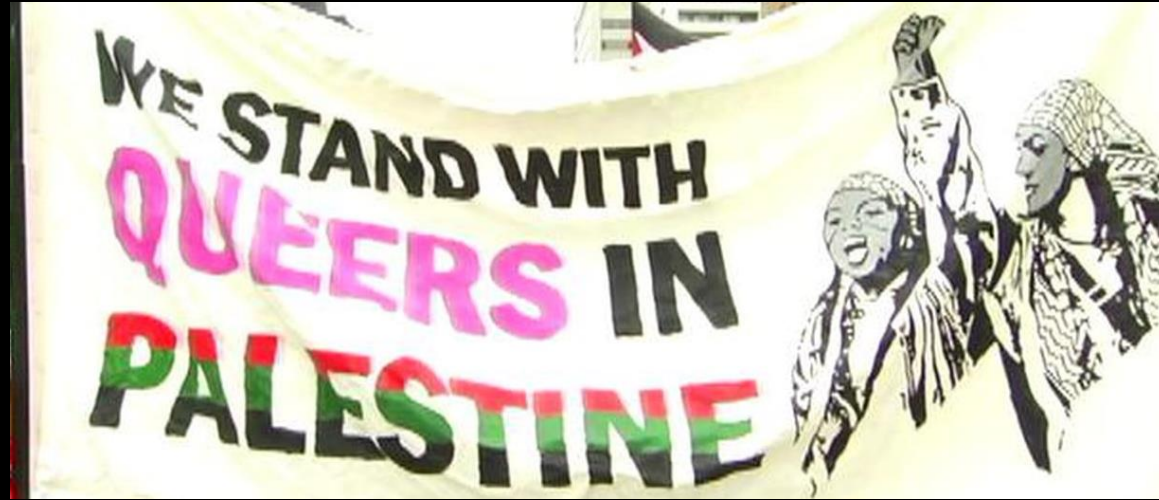
Demo von „Queers against Israeli Apartheid“, Toronto 2011