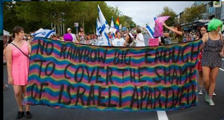
Aktion und Demo Seattle 2015