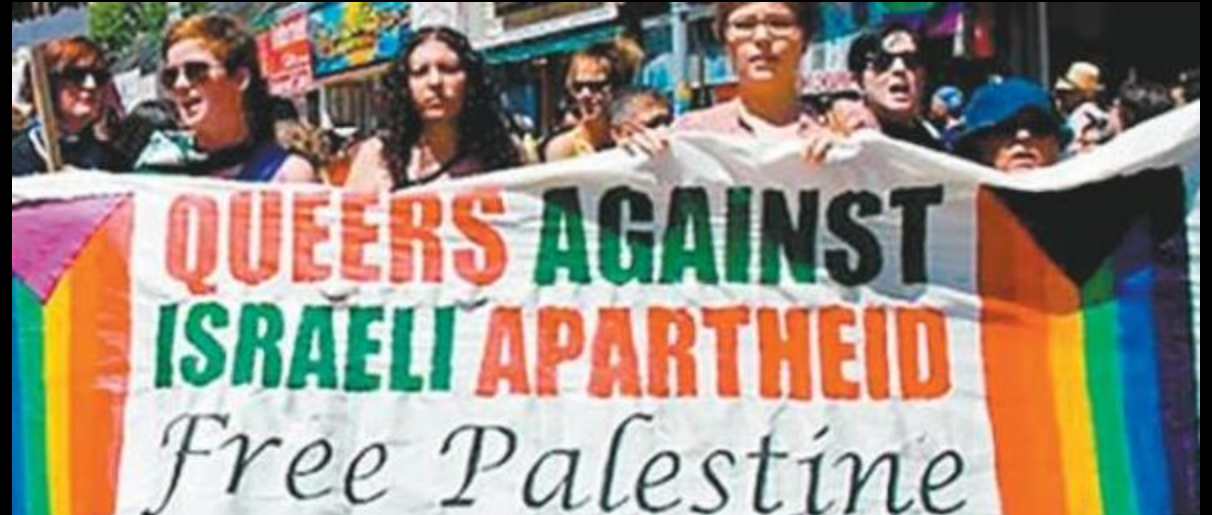
Toronto Demo 2013