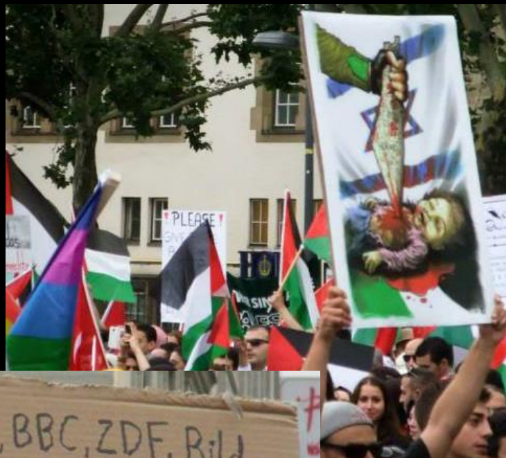
Al-Quds-Demo Berlin 2014