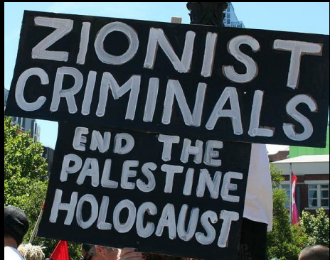
Demo gegen den „Gaza-Krieg“/gegen Israel, Melbourne 2009