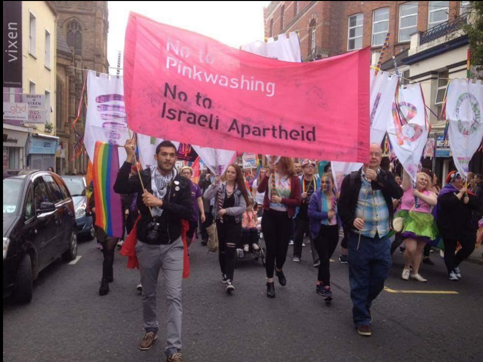
Demo „Against Pinkwashing, USA