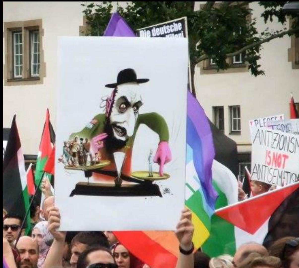
Al-Quds-Demo Berlin 2014