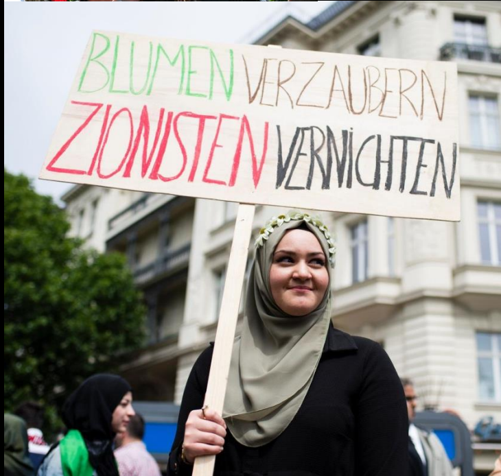
Al Quds-Demo in Berlin