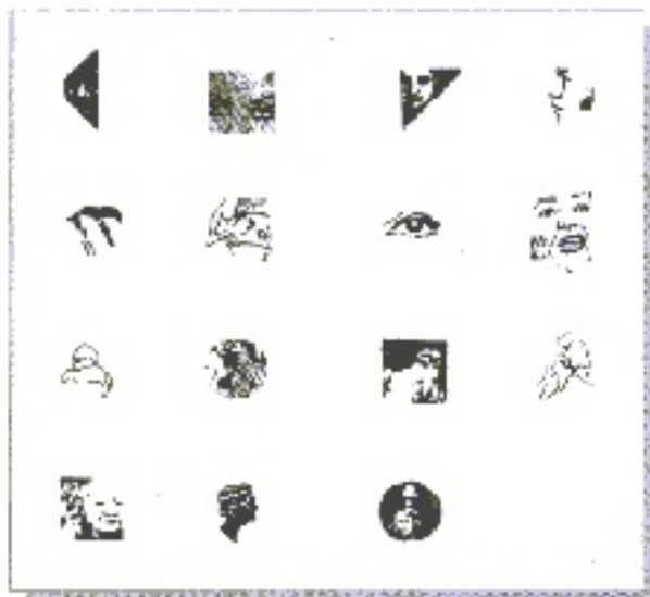
DEZERNAT FRAUEN UND GESUNDHEIT - FRAUENREFERAT -