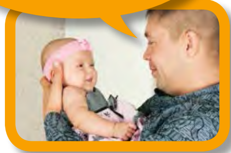
ንዕኡ ወይ ንዓኡ እንትትዛረቢ ናብ ዕሽልኪ ረኣይ።