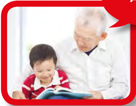
ብሓባር ኣብ ምስላዊ መጽሐፍቲ ንርእ።