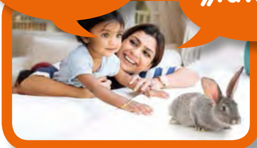
እቲ እትጥቀሙሉ ቋንቋ ምጥቃምን ምስ ዕሽልኪ ብምዝራብ ብዚያዳ ናይ ፈለማ ቋንቋ ተሓጎስሉ።