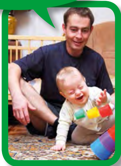
ዕሽልኪ እንታይ ዓይነት ጻወታ ከምዝድሊ ይፈልጥ። ምፅንባር።