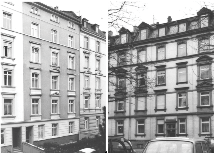
Abbildung 3: „Nicht stilecht sanierte Stilfeassaden“ (Gruppe 3)