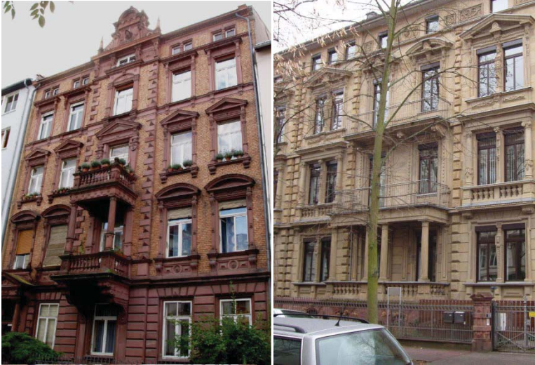
Abbildung 2: „Einfache Stilfeassaden“ (Gruppe 2)