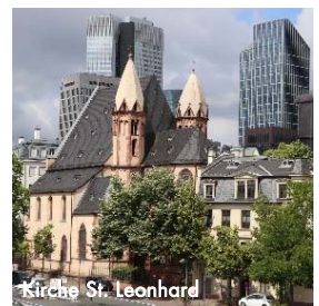
Kirche St. Leonhard