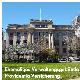
Ehemaliges Verwaltungsgebäude Providentia Versicherung

Die "Hellerhof AG" baute im Stadtteil Gallus im Zeitraum von 1901 - 1932 zwei Wohnsiedlungen, die durch ihr Erscheinungsbild zwar sehr unterschiedlich wirken, aber trotzdem mehr als nur ihren Namen gemeinsam haben. In der Führung wird das Gebiet erkundet und die Gebäude genauer unter die Lupe genommen.