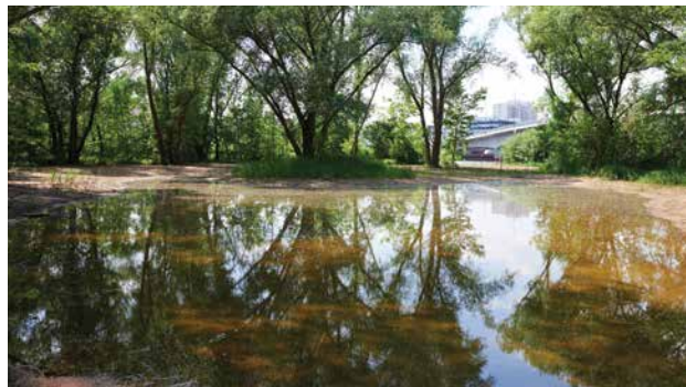
Neuer Altwasserteich nahe der Carl-Ulrich-Brücke (s. auch Luftbild auf der Titelseite, südöstlich der Carl-Ulrich-Brücke)