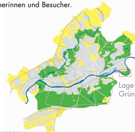
Lage im Frankfurter GrünGürtel

In den nächsten Jahren wird der Fechenheimer Mainbogen nahezu komplett umgestaltet: neue „Altarme“ entstehen, Wege werden angelegt, Brücken gebaut und das Mainufer an einigen Stellen abgeflacht. Insgesamt ein Gewinn für die Natur und ein abwechslungsreiches Naturerlebnis für Besucherinnen und Besucher.