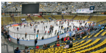
die große Halle 1.800 m 2 Eisfläche

Viermal Eis, in und neben der Eissporthalle: Auf über 9.000 Quadratmetern Eisfläche können Sie Pirouetten drehen, tanzen oder „einfach“ nur eislaufen. Ob Sie Anfänger oder schon Eis-Profi sind – die Eissporthalle bietet jedem das Richtige: