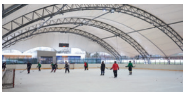
die überdachte Außenfläche 1.800 m 2 Eisfläche