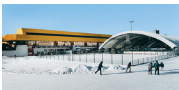
der 400-Meter-Außering 12 m breite Eisfläche

Gerade Eis-Neulingen bieten die umlaufenden Banden in der großen und der kleinen Halle sowie an der überdachten Außenfläche die nötige Sicherheit für die ersten Schritte auf dem Eis. Hintergrundmusik in der großen Halle sorgt für den richtigen Laufrythmus und in der Pistenbar „Cool Running“ können Sie jederzeit eine Pause einlegen. Aber Sie können natürlich auch einfach zuschauen – etwa bei Topturnieren im Eishockey, Eisstockschießen oder Eiskunstlauf.