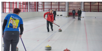
die kleine Halle 675 m 2 Eisfläche