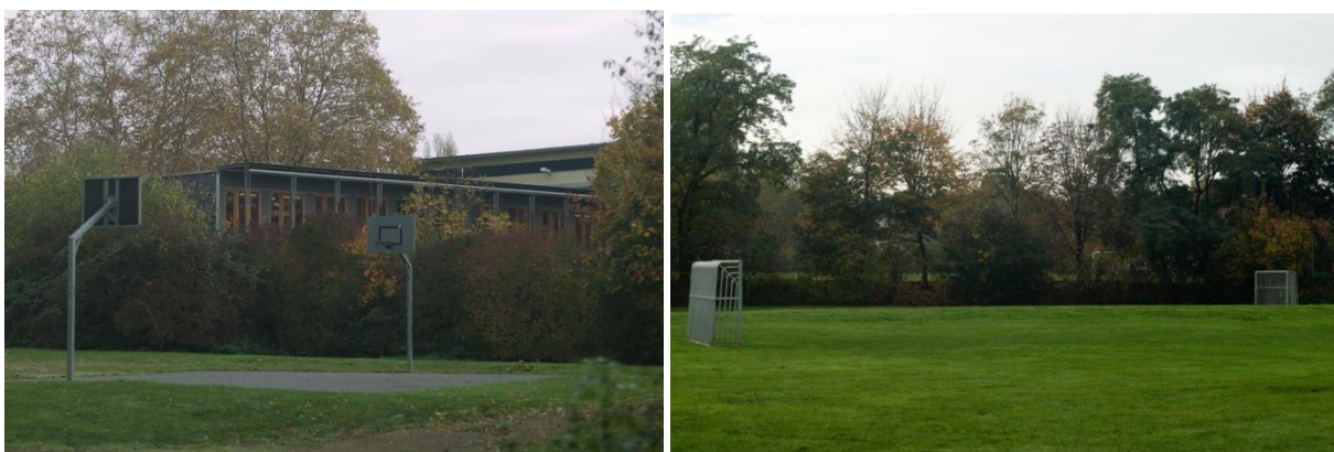
Abbildung 3: An Schule angrenzender Basketballplatz und Rasenfläche