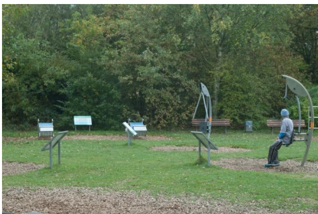
Abbildung 1: Fitnessgeräte im Niddapark