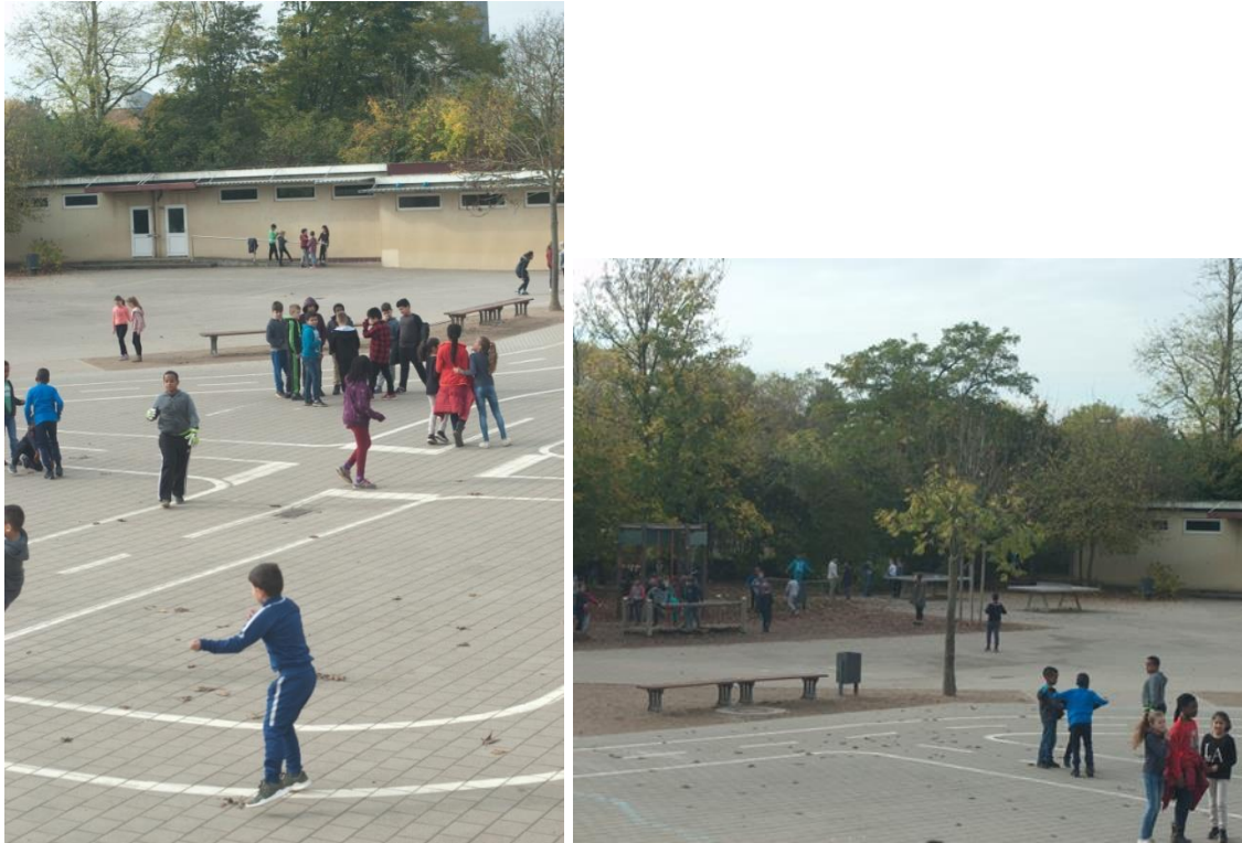
Abbildung 2: Schulhof Astrid-Lindgren-Schule