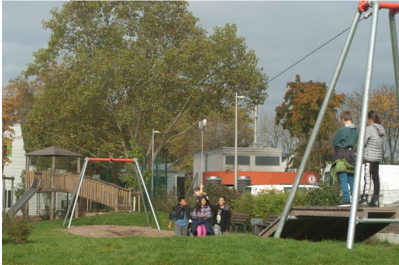
Abbildung 5: Spiel- und Bewegungsraum in der Nähe des Jugendhauses