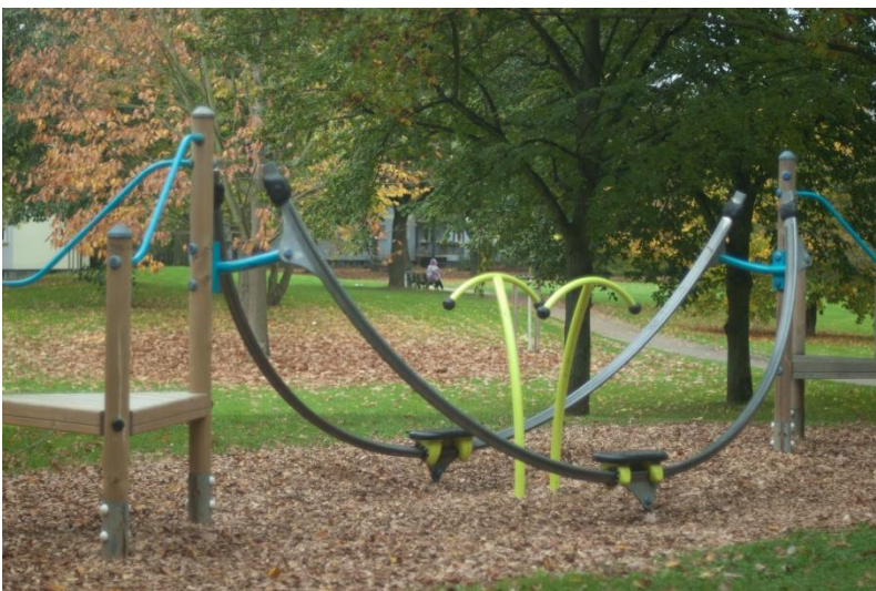
Abbildung 7: Marie-Bittorf-Anlage