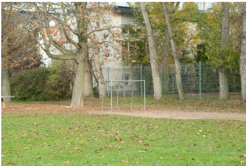
Abbildung 4: Spiel- und Bewegungsraum bei der Franz-Werfel-Straße