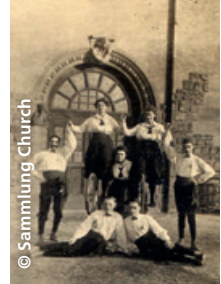
Reigen der „Westend“