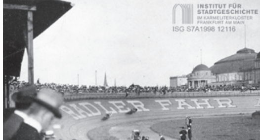
Radrennbahn an der Festhalle 1912