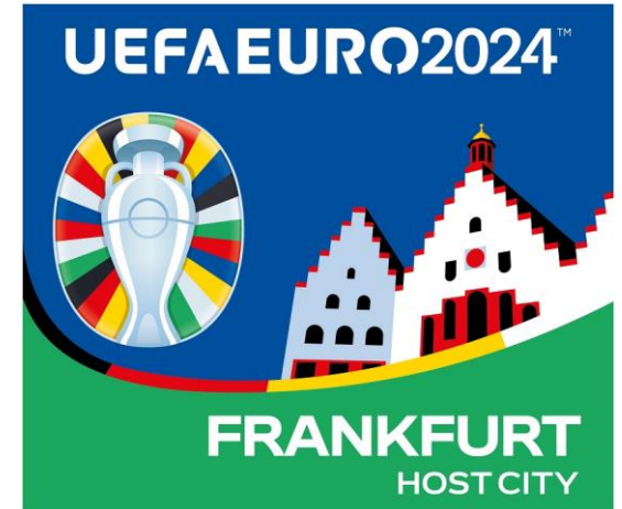
Das Turnierlogo des Spielortes Frankfurt am Main

Die Logo-Präsentation setzte gleichzeitig den Startschuss für die kommenden drei Jahre voller intensiver Vorbereitung auf die drittgrößte Sportgroßveranstaltung der Welt. Auch das Motto der EURO 2024 „United by football – Vereint im Herzen Europas“ passt perfekt zur Sportstadt Frankfurt, die das Megaevent und Meilensteine - wie die Qualifikationsauslosung am 9. Oktober 2022 in der Frankfurter Festhalle - nachhaltig für sich nutzen möchte.