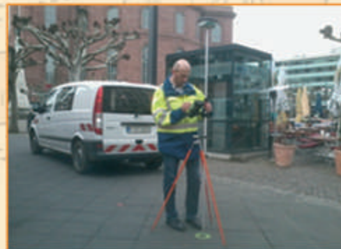
Koordinatenbestimmung des Frankfurter GPS-Referenzpunktes durch das Stadtvermessungsamt

Koordinaten im Bezugssystem ETRS89/ WGS84