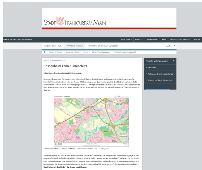
Abbildung 62: Screenshot der Projektwebseite „Sossenheim kann Klimaschutz“

dargestellt werden. In jedem Fall sollte im Sinne der Ziele dieses Konzepts vermieden werden, dass Interessenten und Ratsuchende die gewünschten Informationen aus zu vielen unterschiedlichen Quellen suchen müssen. Ebenso sollte ein Newsletter die Online-Kommunikation ergänzen, in dem sowohl auf aktuelle Ereignisse als auch grundsätzliche Informationen zu Förderzugängen oder laufenden Projekten hingewiesen wird.